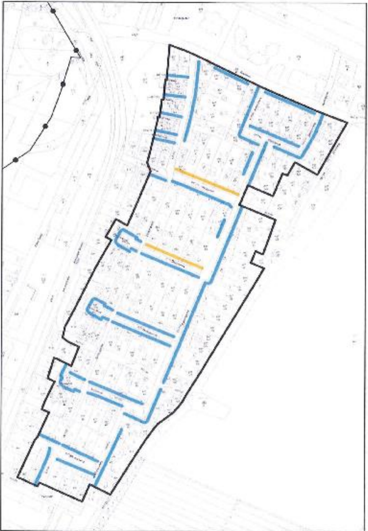
Schutzzone Neufeldsiedlung – Ausrichtung der (Haupt-)Firste